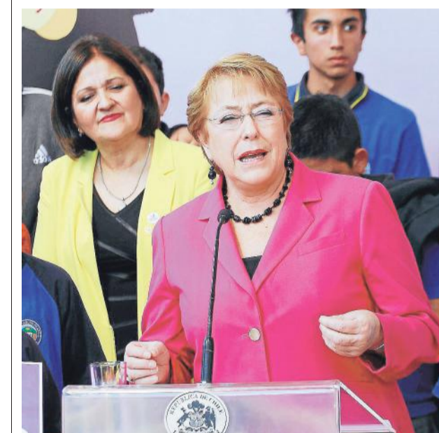
Bachelet hizo la acción judicial como ciudadana.